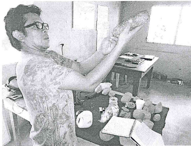
Foto 1: Analizando artefactos líticos de la categoría de manos de moler (Espigares 2019).